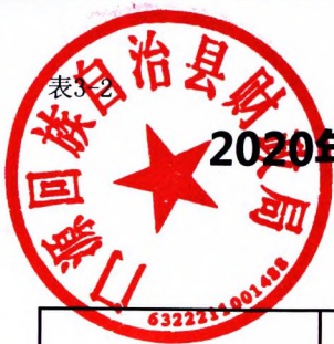
表3-2 2020年--2021年末632221 门源回族自治县发行的新增地方政府专项债券资金收支情况表